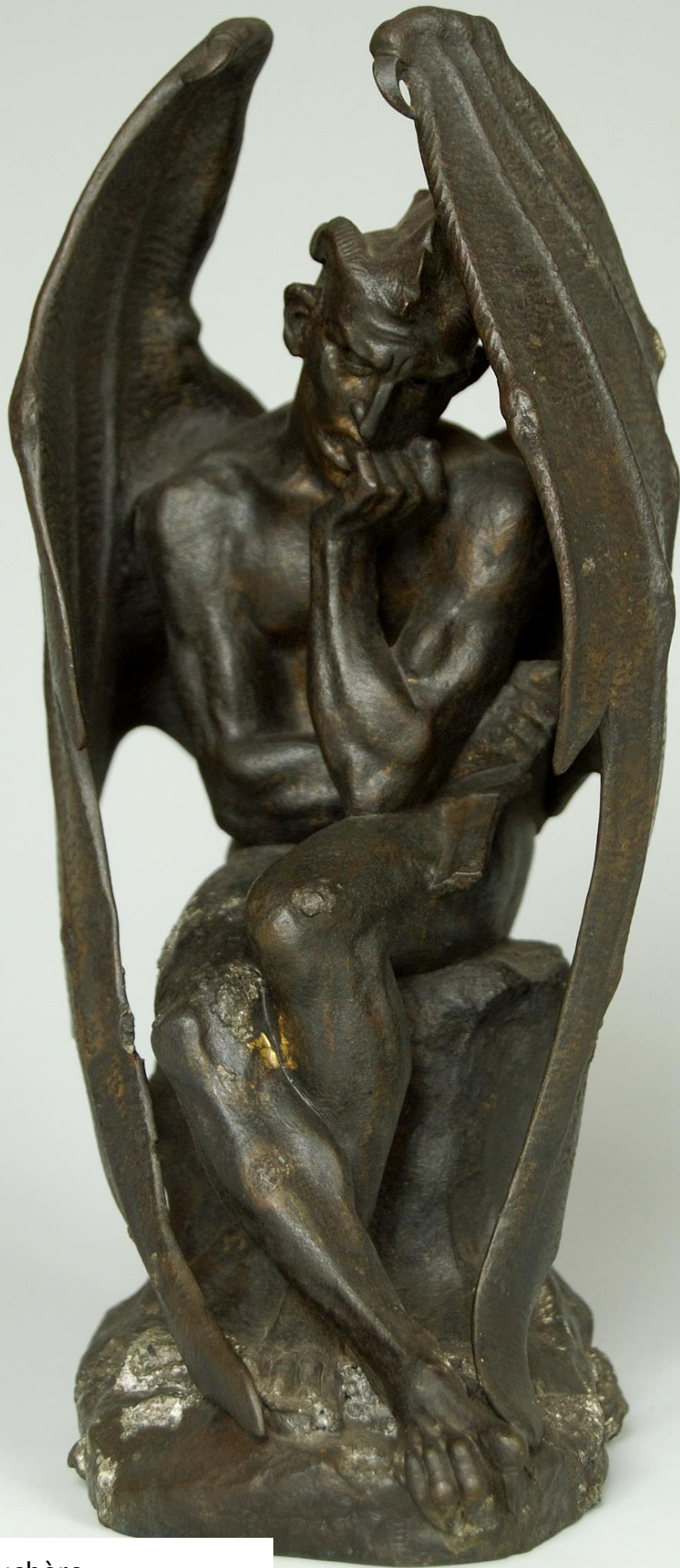
Jean-Jacques Feuchère Satan mélancolique , 1835 Bronze à patine sombre 34,5 x 15,5 cm