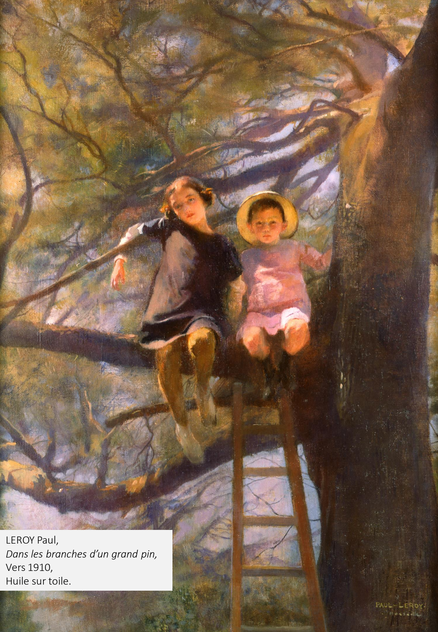
LEROY Paul, Dans les branches d'un grand pin, Vers 1910, Huile sur toile.