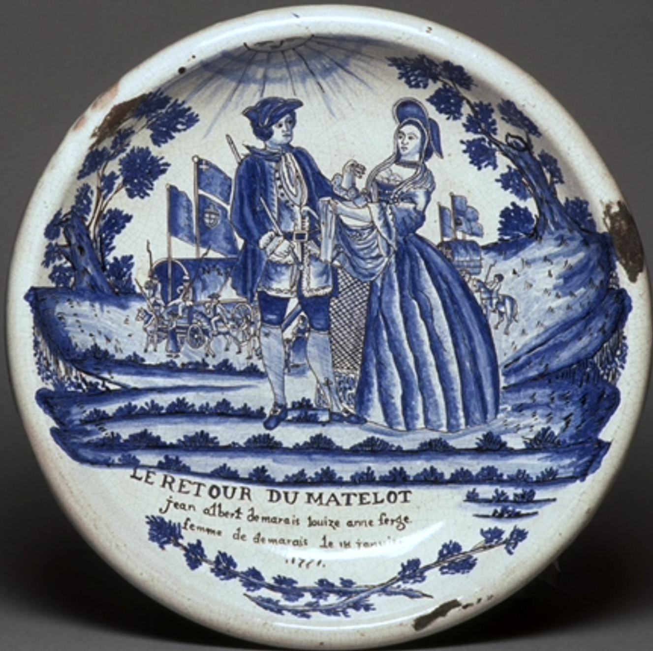
Anonyme, Le retour du matelot , 1771, Plat en faïence stannifère à décor de grand feu, 37cm de diamètre.